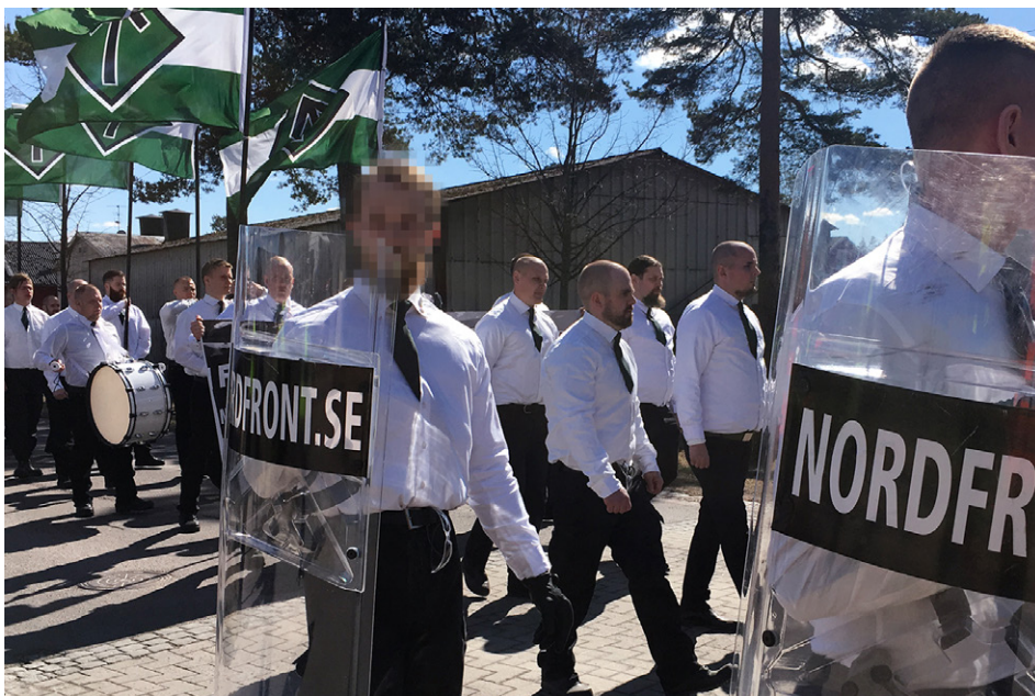
Fra demonstrasjoner