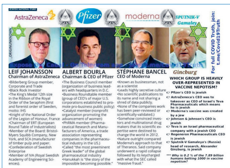
Figur 1: Et bilde som forsøker å formidle jøders innblanding i vaksineproduksjon.

Bilder som hentydet til at jøder står bak coronaviruset, dets spredning, og/eller vaksinen, som for eksempel ved figur 1.