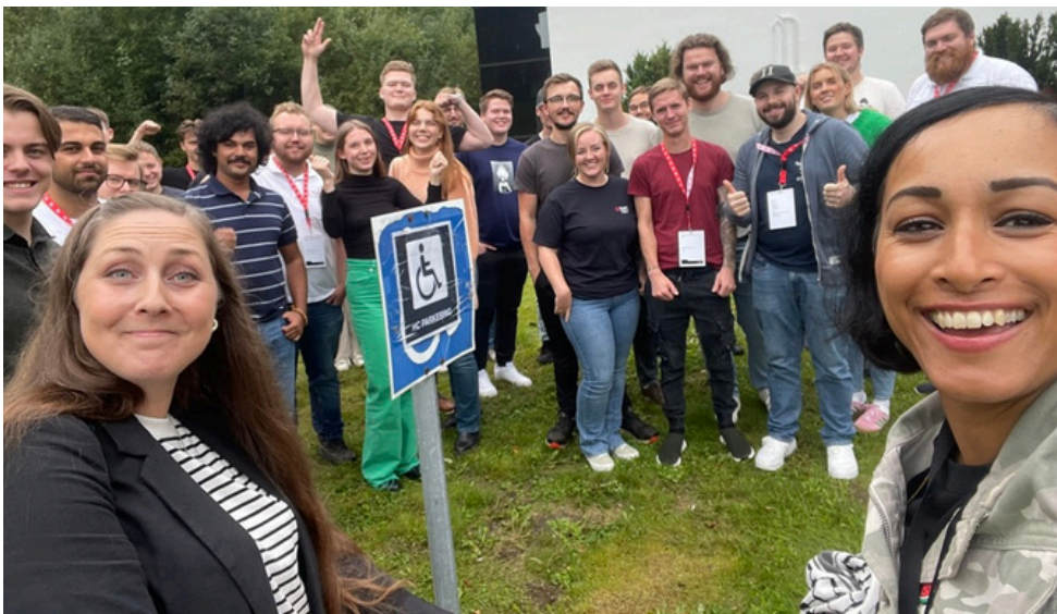
På samling hos EL og IT Ung