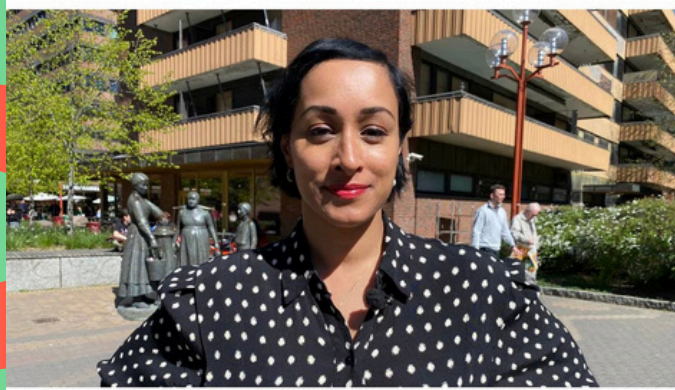
Sak hos Nrk om nazikonsert

Flere frykter at nynazister i festivalhumør trekker inn til hovedstaden.