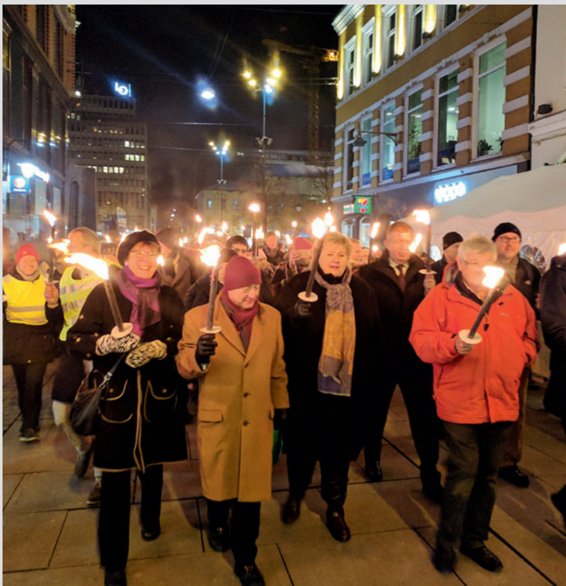
Både statsminister Solberg og ordfører Borgen deltok i fakkeltoget fra Youngstorget til Nationaltheatret for å markere novemberpogromene (krystallnatten).