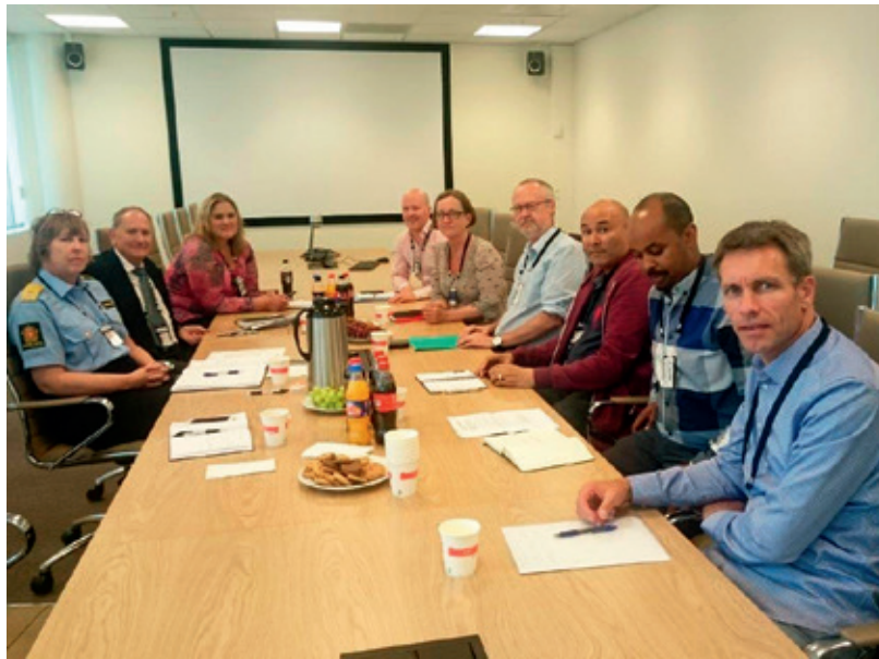
Etter sterke reaksjoner fra folk som hadde mistet fødestedet sitt i passet, inviterte Politidirektoratet organisasjonene som hadde engasjert seg i saken til et dialogmøte.