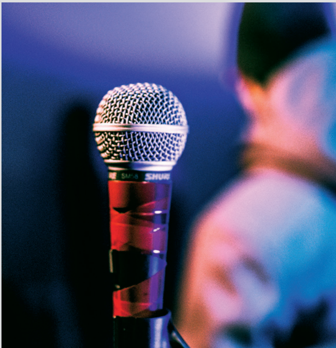
Åpen Scene hos Agenda X.