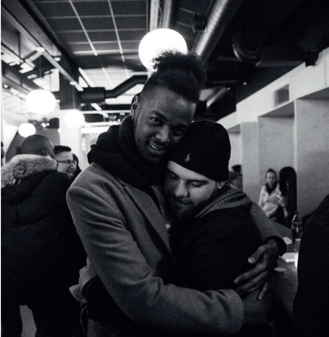
Agenda X' julefest.