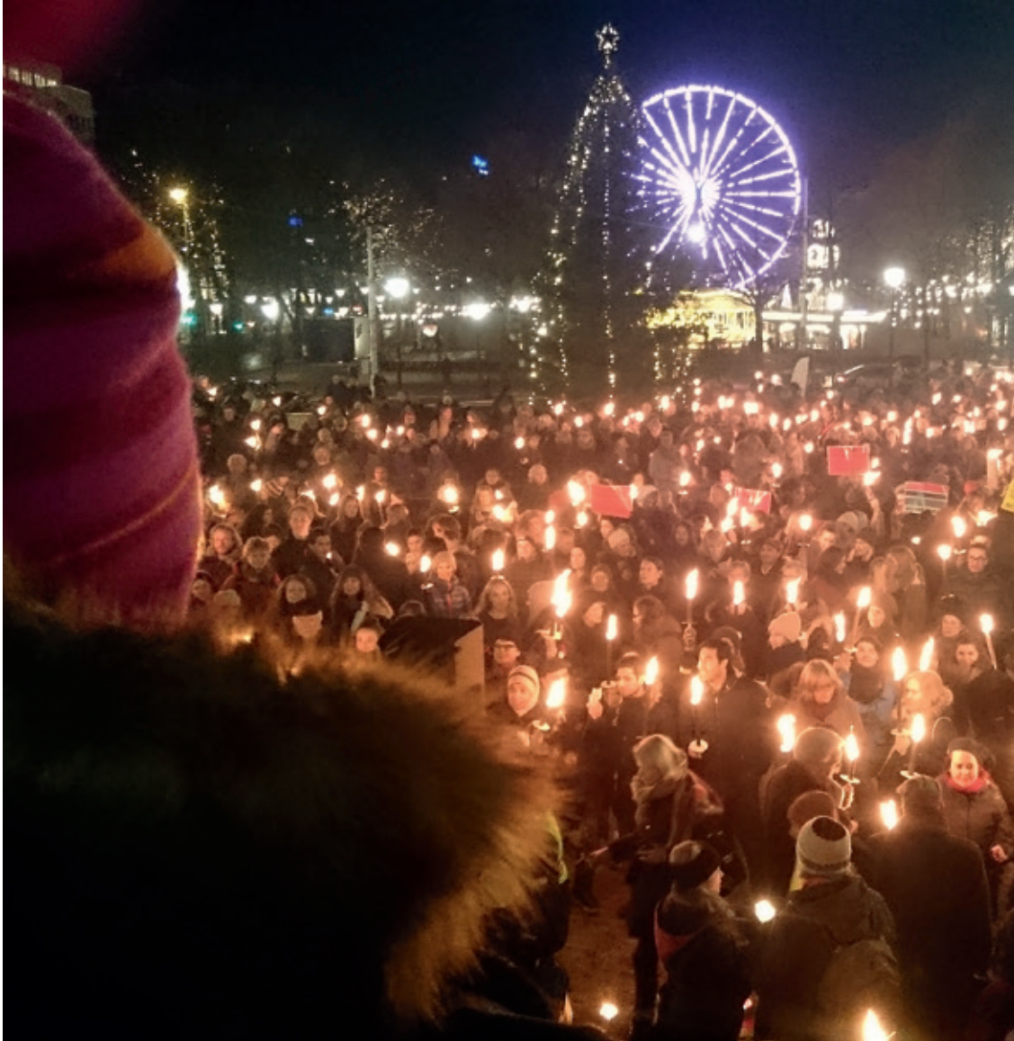
Markeringen «Tusen lys for mennesker på flukt».