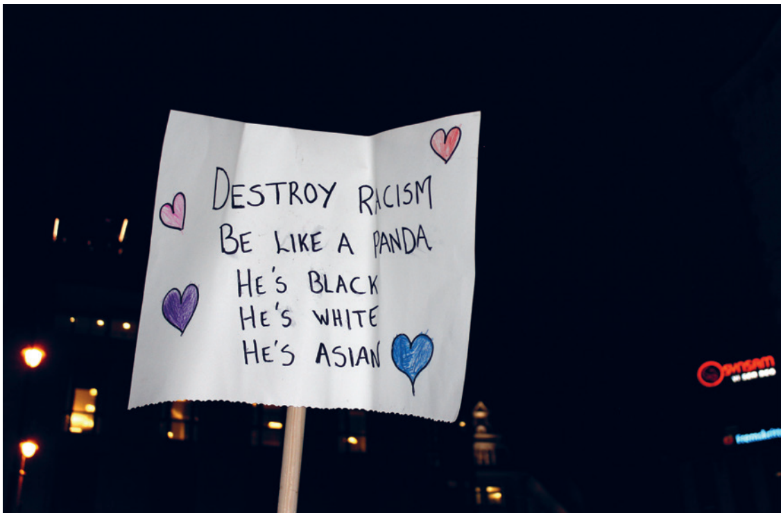
Fra demonstrasjon mot nazisme utenfor Stortinget 30. november 2018