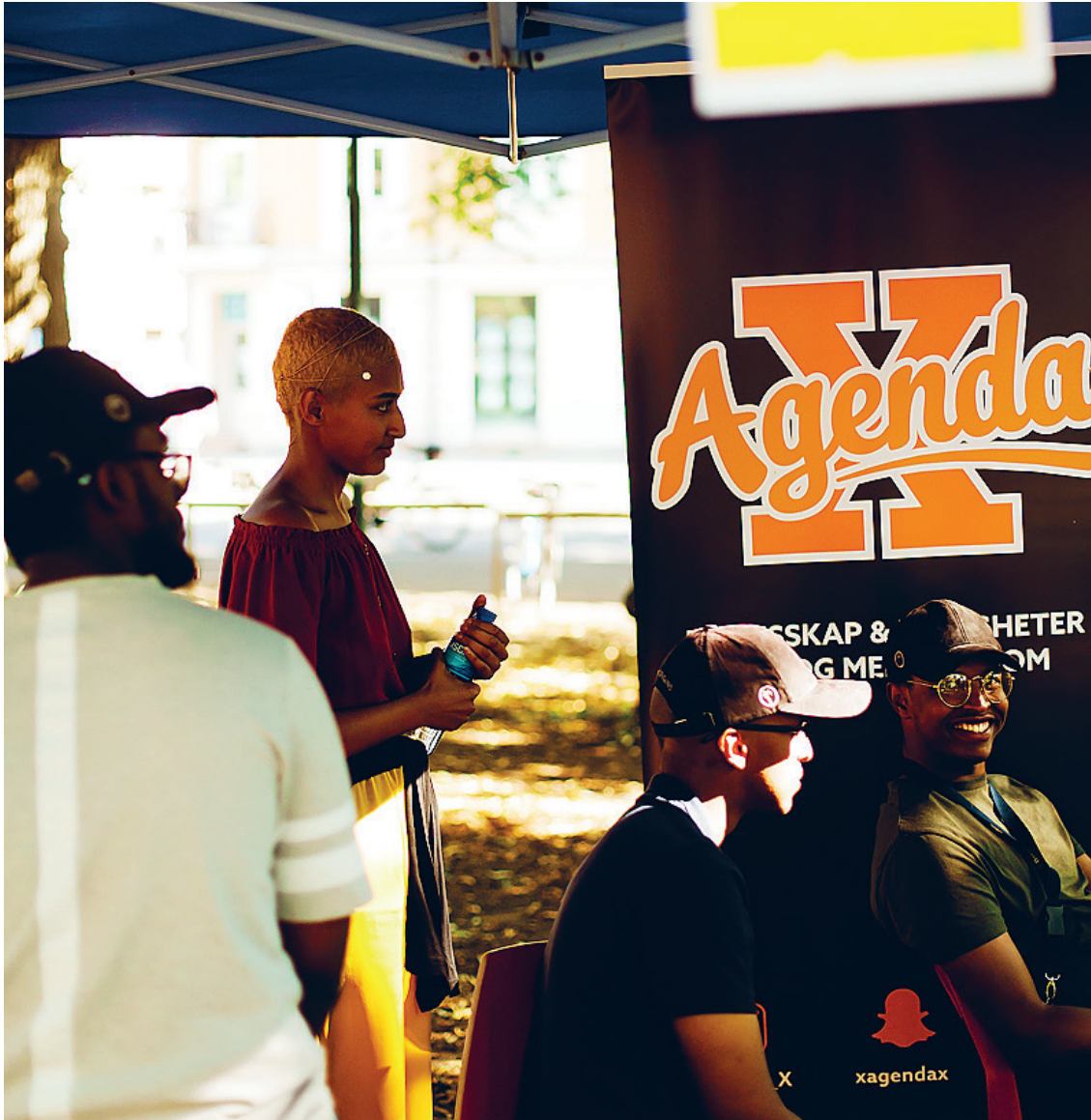
Festival for alle, juni 2018