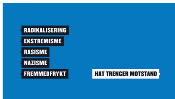
Kampanje: Hat trenger motstand, utarbeidet av Kitchen