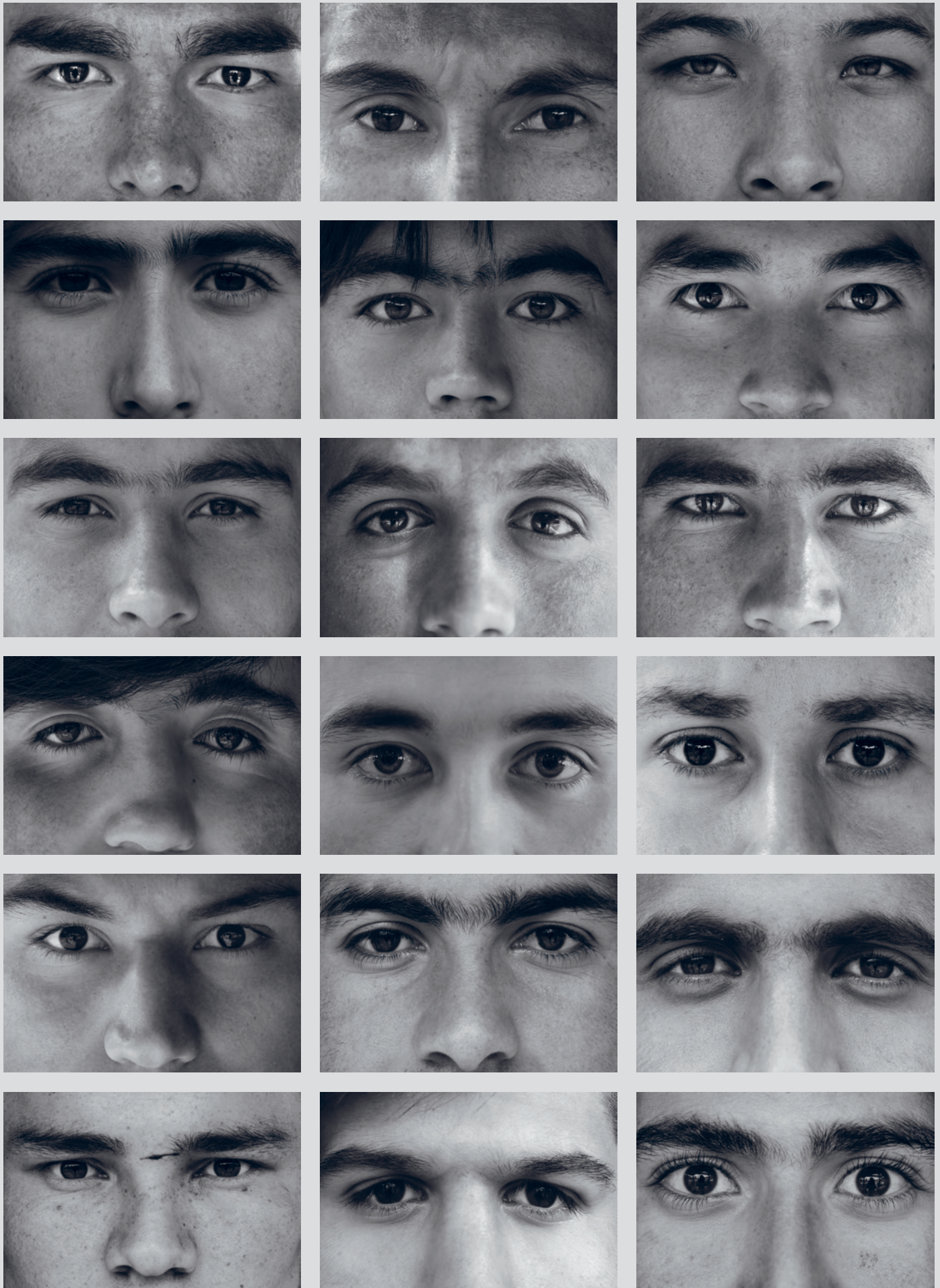
«Øyne»: fotoutstilling og markering for afghanske asylsøkere utenfor Stortinget 18. juni 2018 (utdrag).